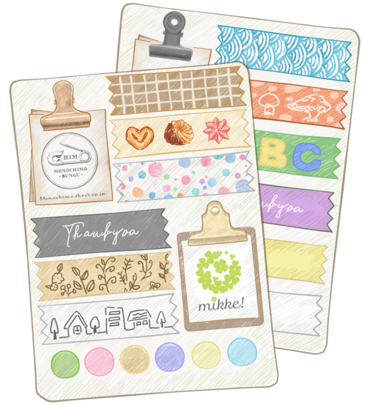
選ばれたデザインを1枚にまとめ オリジナルシールを作成します